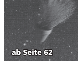
ab Seite 62