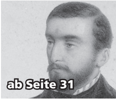
ab Seite 31