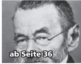
ab Seite 36